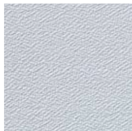
F 46 hellgrau