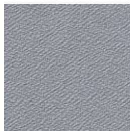
F 44 mittelgrau