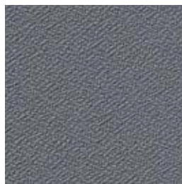
F 45 dunkelgrau