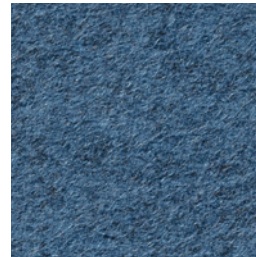
A 267 night